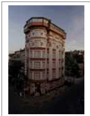
hotel Pamphylia

vonden we een hotel voor 9€/nacht per persoon. We zaten op het zesde verdiep, hadden een balkon en konden ontbijten op een ander balkon met zicht op de Aya Sofia en de blauwe moskee. Beter konden we niet wensen.