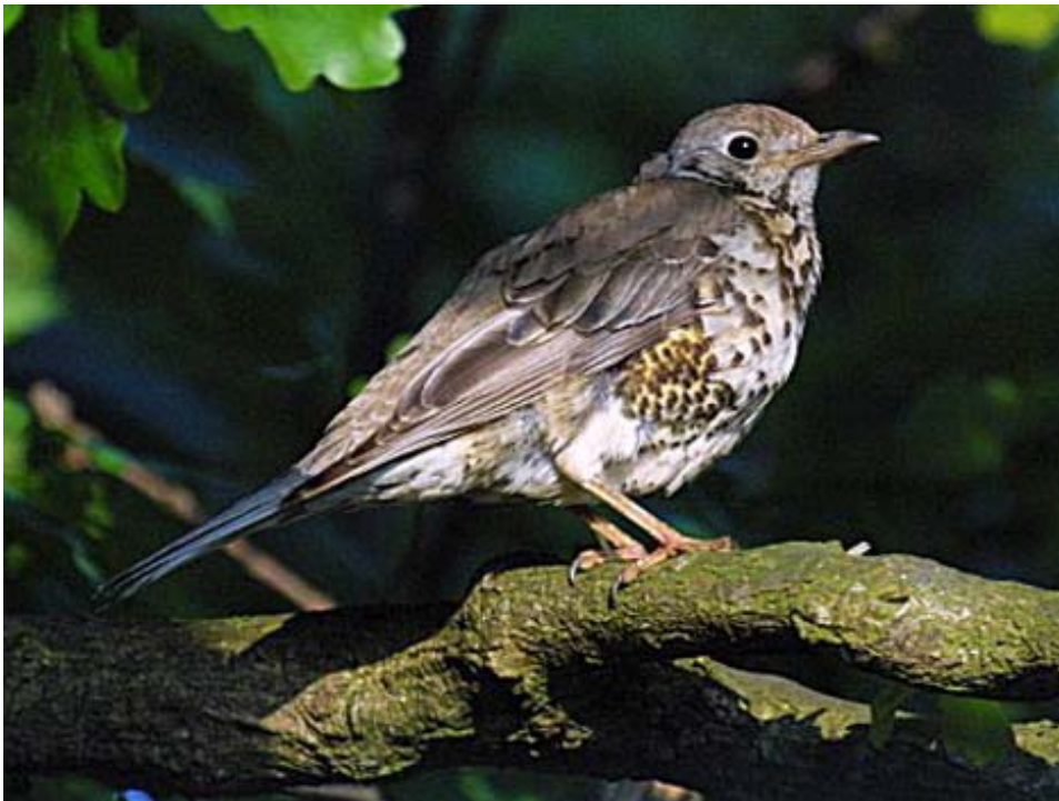
Een ruiend adult Grote Lijster.

Het kon dus wel stukken moeilijker gemaakt hebben met een foto gelijk deze hier: