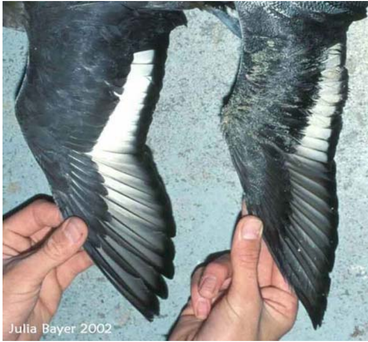
Julia Bayer 2002