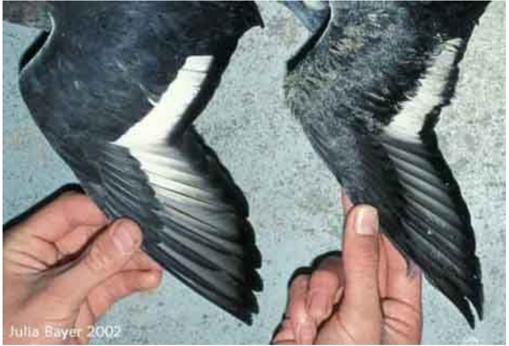
Julia Bayer 2002